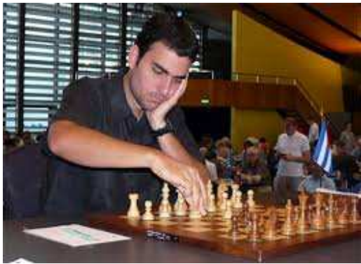
GM Leinier Domínguez Pérez