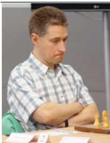
Michael Adams, campeón

El XCVIII Campeonato de Gran Bretaña se celebró entre el 25 de julio y el 6 de agosto 2001, en Sheffield (Inglaterra). Fue el campeonato nacional más fuerte de Gran Bretaña de la historia. Aparte del torneo magistral también se disputaron los campeonatos por categorías de fuerza (sub-2000, sub-1800, sub-1400) y también por categorías de edad: veteranos, sub-16, sub-14, sub-13, sub-12, sub-11, sub-10, sub-9 y sub-8.