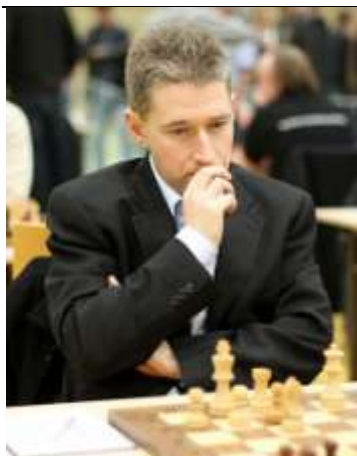
M. Adams (2745) - F. Caruana (2829) Apertura Española (C90) Clásico de Londres (1), 10.12.2014

1.e4 e5 2.Cf3 Cc6 3.Ab5 a6 4.Aa4 Cf6 5.0-0 Ae7 6.Te1 b5 7.Ab3 0-0 8.d3 d6 9.c3 Ca5 10.Ac2 c5 11.Cbd2 Cc6 12.Cf1 h6 13.Ce3 (poco usual) 13...Te8 14.a4 Ae6 (20 minutos) 15.h3 Af8 16.Ch2 b4