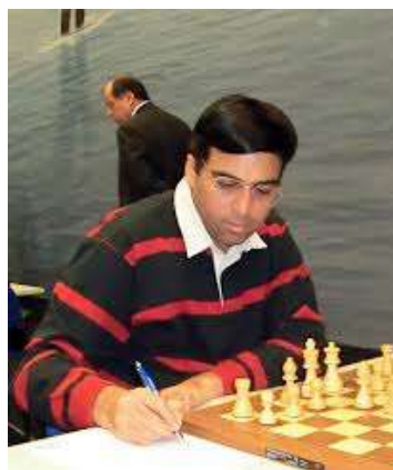
M. Adams (2745) - V. Anand (2793) Apertura Española (C67)

52.Dxd6! Dxd6 53.c7 e4+ 54.g3 Axc3 55.c8D+ Rh7 56.Dxc3 f4! 57.gxf4! Dxf4+ 58.Dg3 Dd2 59.Dc7+ Rg6 60.Db6+ Rh7?! 61.Db7+ Rh8 62.Da8+! Rg7 63.Dxe4 Rf6 64.Df3+ Rg6 65.Rg2 Da2 66.De4+ Rf6 67.Df4+ Rg6 68.Dd6+ Rg7 69.De5+ Rh7 70.a5 Dg8+ 71.Rh2 Df7 72.De4+ Rg7 73.a6 , y Caruana se rindió. 1-0