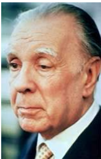
Jorge Luis Borges