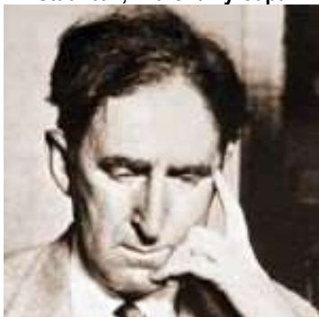
Keres y Vidmar