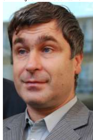
IVANCHUK CAMPEÓN DE GIBRALTAR

1.d4 e6 2.c4 Ab4+ 3.Cd2 d5 4.Cgf3 Cf6 5.Da4+ Cc6 6.a3 Axd2+ 7.Axd2 Ce4 8.Af4 g5 9.Ae3 f5 10.g3 0-0 11.Td1 Rh8 12.Ag2 f4 13.Ac1 g4 14.cxd5 exd5 15.Ce5 f3 16.exf3 gxf3 17.Axf3 Cxe5 18.dxe5 Cc5 19.Dd4 Txf3 20.Dxc5 c6 21.0-0 Ae6 22.Dd6 De8 23.Ag5 Df7 24.Af6+ Rg8 25.Rg2 Tb3 26.Td2 Te8 27.f3 Dg6 28.Tff2 Dh6 29.g4 Te3 30.h4 Df4 31.Db4 Dxb4 32.axb4 Tb3 33.Td4 a5 34.bxa5 c5 35.Ta4 Ta8 36.Ae7 Tb5 37.Tf4 d4 38.Tf6 Ad5 39.Td6 c4 40.Ad8 c3 41.bxc3 dxc3 42.e6 Axe6 43.Af6 Ta6 44.Td8+ Rf7 45.Axc3 h5 46.Td4 Tc6 47.Tf4+ Rg8 48.Ad2 Rg7 49.Te2 Rg6 50.Rg3 Td5 51.Tfe4 Rf7 52.Tb4 Ac8 53.Ae1 Tc1 54.Tbe4 Tcc5 55.T2e3 Rg6 56.Ac3 Tc6 57.Te7 hxx4 58.fxx4 Tc4 59.Tg7+ Rh6 60.g5+ Rh5 61.Th7+ Rg6 62.Th6+ Rf5 63.Tf6# 1-0