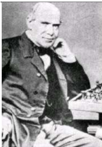
Adolf Anderssen (1818-1879)