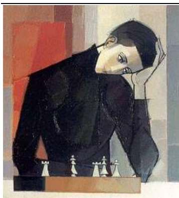
por Darwin Contreras y Juan J. Valenzuela L

"En el ajedrez un maestro debe jugar la apertura como un libro, el medio juego como un mago y el final como una máquina" Irving Cherner