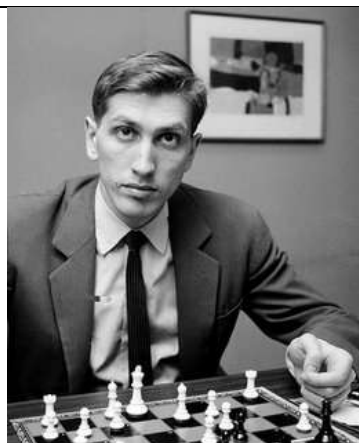
Fischer,R - Tal, M [B47] Bled, 04.09.1961