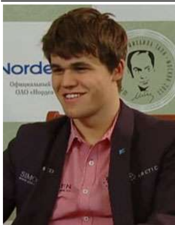
MAGNUS CARLSEN CAMPEÓN

El 25 de noviembre finalizó el torneo y la Clasificación final fue la siguiente: