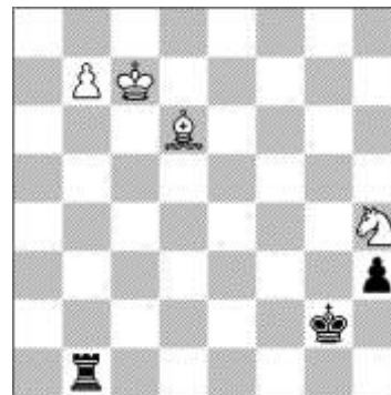
Aronian,L (2805) - Kamsky,G (2732) [A15]

Rf5 55.Cxb4 Tc1+ 56.Rd4 Te1 57.Cc6 Te4+ 58.Rd5 Txb4 59.b4 Th1 60.b5 Tb1 61.Cd4+ Rg4 62.Rc6 Tc1+ 63.Rd7 Tb1 64.Rc7 h4 65.b6 Rh3 66.b7 Rg2 67.Cf5 h3 68.Ch4+ 1-0