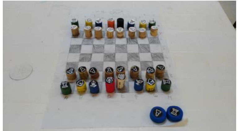
Juego elaborado con material reciclado.

De la mano de Ajedrez sin Fronteras, colaborador en este proyecto, enseñamos cómo hacer juegos de ajedrez con material reciclado. Así, elementos de desecho como tapones y corchos se transforman en peones, caballos y otras piezas de ajedrez.