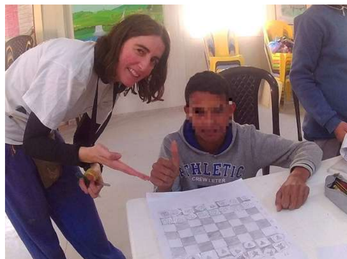
Uno de los niños muestra orgulloso el tablero y piezas realizados.