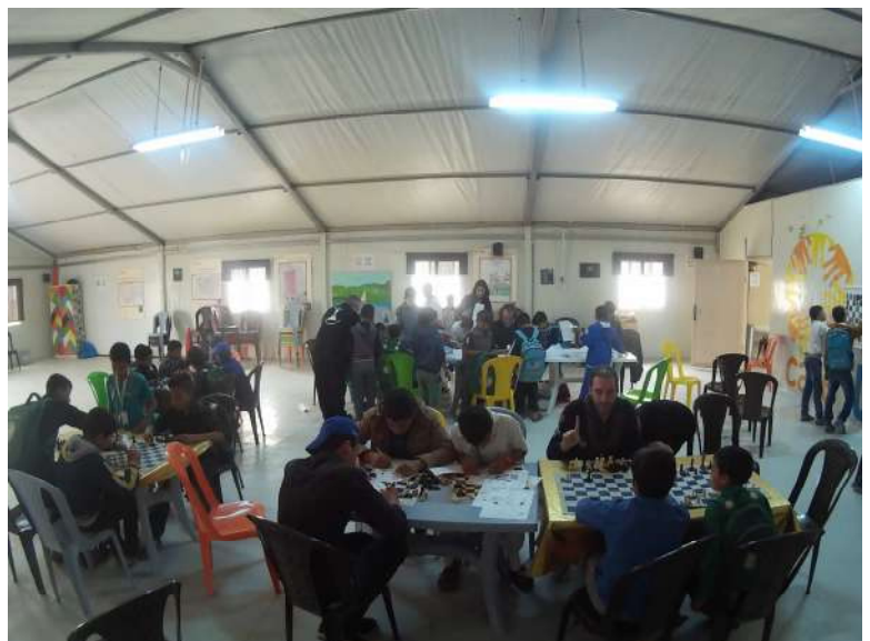
La sala de actividades al inicio de la jornada.

El ambiente es de alegría y colaboración entre todos.