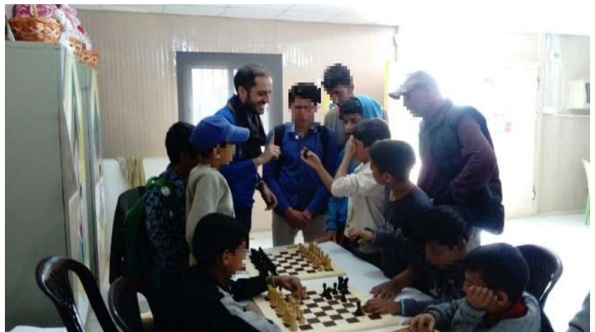
El Maestro Internacional y FIDE Trainer de la Escola Xadrez Pontevedra explicando la dinámica de los juegos adaptados

A las 12 las niñas salen del colegio y se integran en ajedrez.