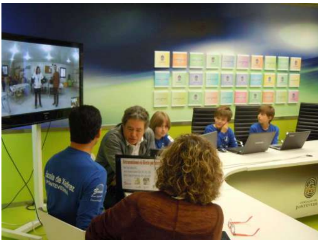
Conexión vista desde Pontevedra

Fue un importante paso para poder seguir aportando nuestro granito de arena.