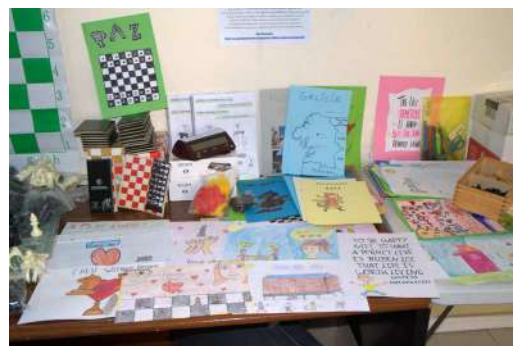
Trabajos de alumnado de Pontevedra