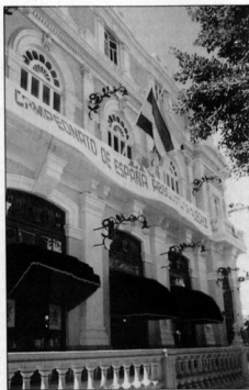
Un ámbito insólitamente lujoso para el Campeonato de España.