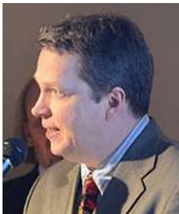
1º NIGEL SHORT

En este Torneo, jugado desde el 24 de enero hasta el 2 de febrero de 2012, salieron primeros la china Hou Yifan y el inglés Nigel Short, con 8 puntos en 10 rondas, pero tras un desempate a dos partidas, se clasificó Campeón el inglés Nigel Short.