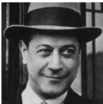
"Entrevista de la revista El Gráfico, 1939"