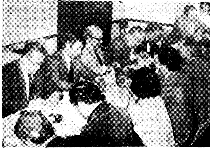
Un momento de la votación.

Diez fueron las deportistas femeninas que alcanzaron vo-